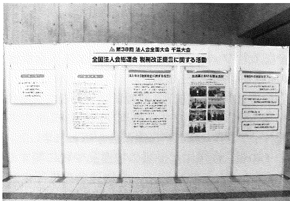
全国大会での税制提言に関するパネル展示