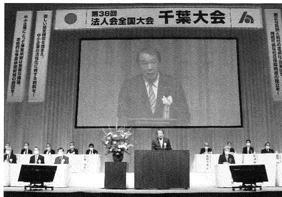
全国大会では税制改正に関する提言内容を周知