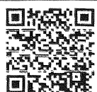
財務省リーフレット「インボイス制度、支援措置があるって本当!？」