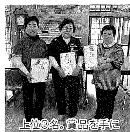
上位3名。賞品を手に入