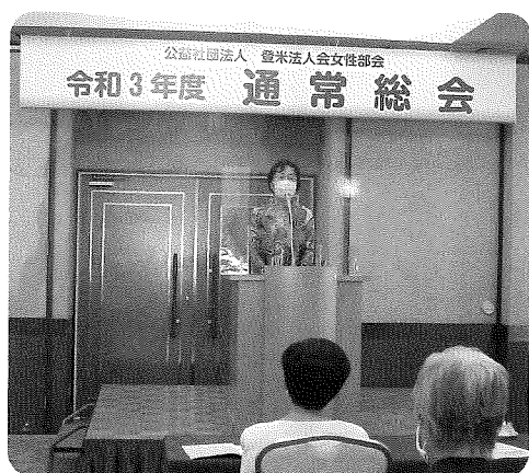
挨拶する浅野女性部会長

また、青年部会では、急遽、予定していた日程での開催が難しくなり、書面決議で行われました。